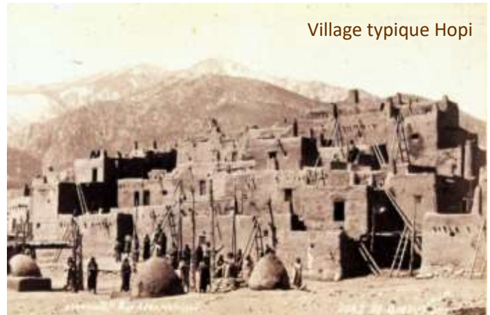
Village typique Hopi

Une fois terminée, je prends ma veste et me précipite hors de ma chambre. Direction : cette fête foraine, loin de l'ambiance ouatée du palace, encore trop douce pour mon acclimatation. J'ai besoin d'un plongeon radical dans le bain d'Arizona.