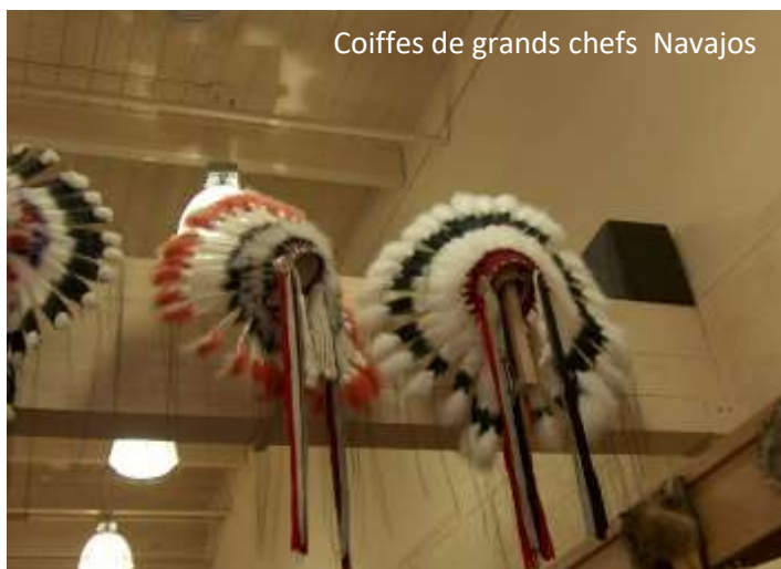
Coiffes de grands chefs Navajos

La conversation vire sur la question des Amérindiens, qui se battent toujours pour préserver leur territoire et leurs droits de citoyens, mais aussi pour faire revivre leurs traditions bâties sur leur religion animiste 4 . La question concerne particulièrement l'Arizona, un état qui s'est construit sur les terres d'une multitude de peuples indiens : Navajo , Apaches , Hokoham , Hopis , Havasupai , Quechans , Pimas , Cocopa , etc.