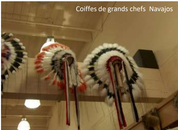
Coiffes de grands chefs Navajos

La conversation vire sur la question des Amérindiens, qui se battent toujours pour préserver leur territoire et leurs droits de citoyens, mais aussi pour faire revivre leurs traditions bâties sur leur religion animiste 4 . La question concerne particulièrement l'Arizona, un état qui s'est construit sur les terres d'une multitude de peuples indiens : Navajo , Apaches , Hokoham , Hopis , Havasupai , Quechans , Pimas , Cocopa , etc.