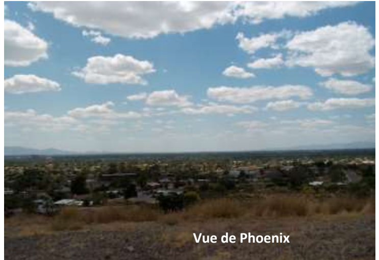
Vue de Phoenix

L'info fait tilt dans ma tête. Mes emplettes western ! Pour les faire, je vais avoir besoin d'un chauffeur. J'oublie d'aller à pied dans une zone commerciale. Et en plus, je ne sais pas où je peux trouver ces articles, qu'on ne peut pas qualifier de produits de la vie courante, hormis peut-être les jeans. Mais un stetson 7 , des bottes, des gants... On trouve ça où ? Dans des boutiques spécialisées ? Je parle donc de mon projet de ranch.