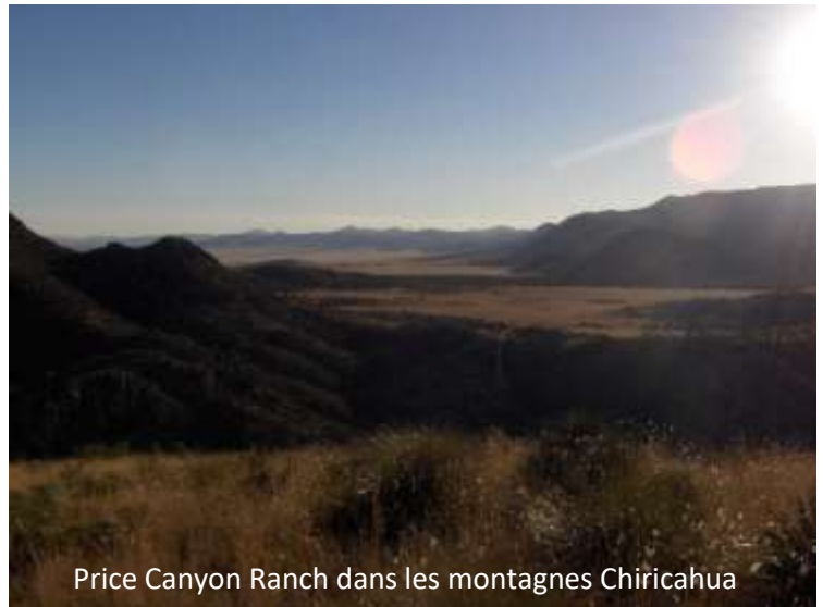
Price Canyon Ranch dans les montagnes Chiricahua

La météo annonce 35°C à l'ombre. J'ai intérêt à prévoir eau et fraîcheur pour ce voyage de cinq heures. Enfin, quatre heures plus une pause, si je ne me plante pas ! Après une bonne douche, j'ai opté pour une tenue très pratique et légère : tee-shirt en coton, short en jean, sandales. Je serai à l'aise pour conduire.